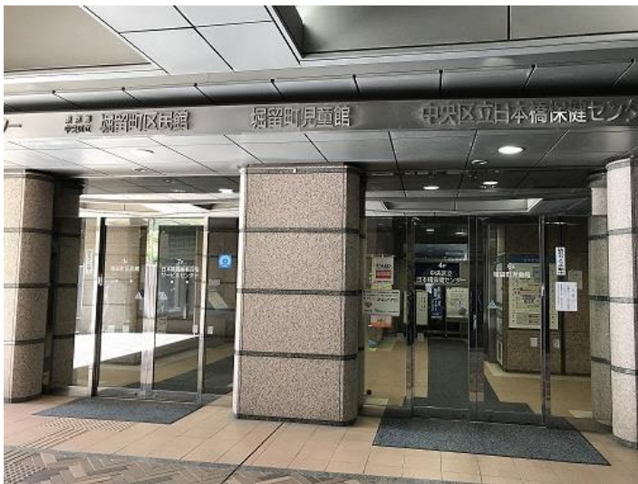
日本橋保健センター入口 (堀留児童公園横)