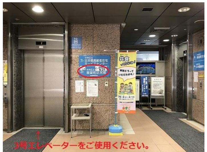
正面のエレベーターをご使用ください。